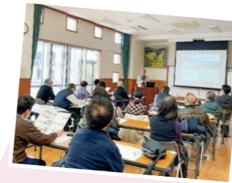
歴史講座の様子です。発掘の様子を写真で見たり、本物の土器に触れたり貴重な体験ができました!

そのほかにもさまざまなイベントを企画していきますので、最新情報は館内のお知らせやTwitterなどをご確認ください。