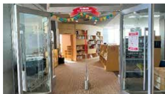
▲さわらみなみとしょかんまつり

11月には2周年を記念して、「さわらみなみとしょかんまつり」と題し、スペシャルなおはなし会や工作会などを開催する予定です。期間中は館内も特別な飾りつけをして、お祝い気分を盛り上げていきます! イベント内容については順次お知らせしていきますので、館内の掲示板や総合図書館・ともてらす早良のホームページをチェックしてみてください。