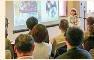
写真は過去開催分