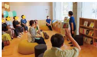
▲祝・早良南図書館2周年!

ともてらす早良と同じく、早良南図書館も11月で2周年を迎えます。この1年の間に、新たなイベントとして読書会「つきよみ」と大人のためのおはなし会がスタートしました。これからも幅広い年代の方と読書に親しむ場を作っていきたいです。