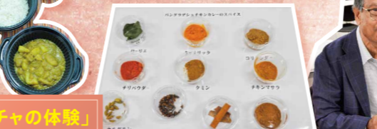
文化紹介 「バングラデシュカレーとチャの体験」