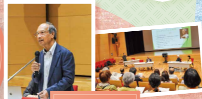
シンポジウム 「バングラデシュと手をつなぐ会 35年の歩み」