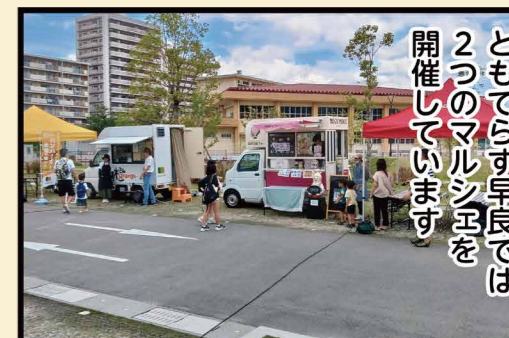
ともてらす早良では2つのマルシェを開催しています