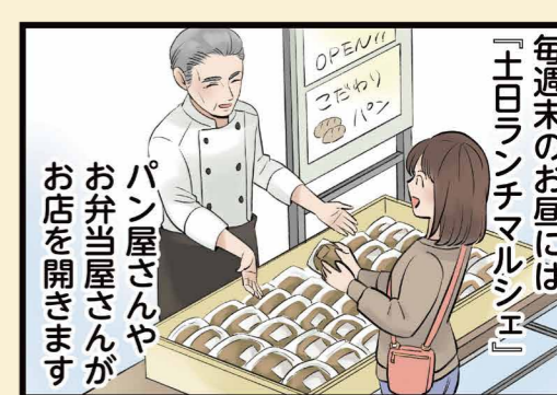
毎週末のお昼には「土ロンドンチマルシェ」 パン屋さんやお弁当屋さんがお店を開きます