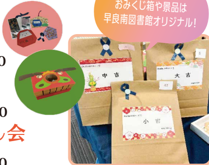
▲昨年のおはなし会の様子