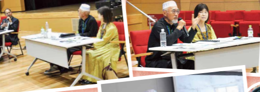
在宅ホスピスを語る会