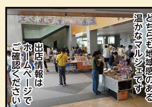
どっちらも地域感のある温かなマルシェです 出店情報はホームページでご確認ください