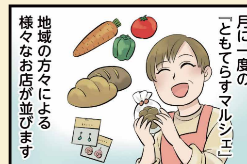
月に一度の「ともてらすマルシェ」 地域の方々による様々なお店が並びます