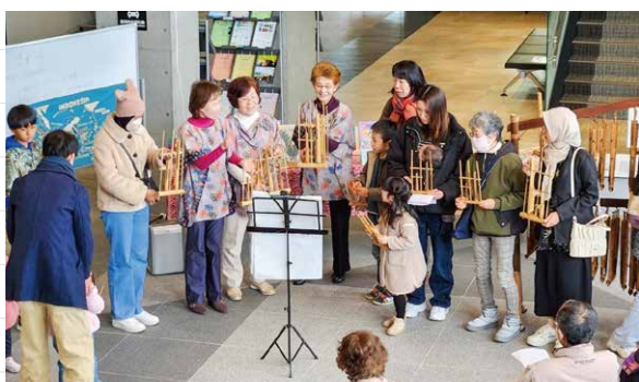
ともてらす早良でのスラムシアンさわら

これまでも、国際イベントや地域の文化発表会、ともてらす早良内に併設されている早良南図書館の