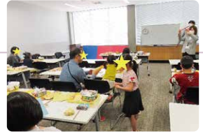
▲昨年のこどもの読書週間 工作会の様子

2025年度がスタートしました! 皆さんが楽しく図書館を使っていただけるように、スタッフ一同気持ちを新たに頑張っていきます。今年度最初の注目は4月23日(水)～5月12日(月)の「こどもの読書週間」です。図書館に来ることを楽しみにしてもらえるようなイベントを開催していきます。どうぞお楽しみに!