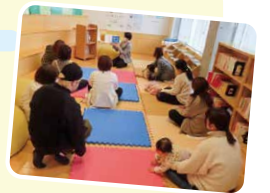
すくすくおはなし会 の様子

☆すくすくおはなし会は0、1、2歳向けのお話を読みます。☆わくわくおはなし会は小学生以下の児童向けのおはなし会です。 ☆おはなし会の事前予約は不要です。当日におはなしのへやにお集まりください。 ☆「つきよみ」は要予約です。詳しくは早良南図書館までお問い合わせください。